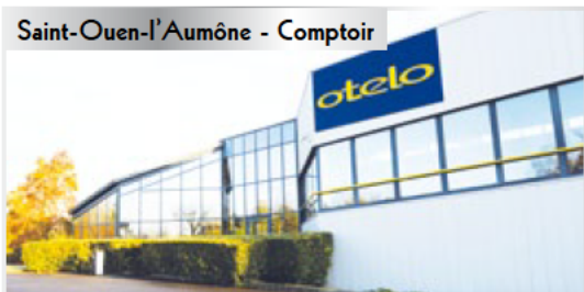
Saint-Ouen-l'Aumône - Comptoir

Parc d'activités des Béthunes - 11, avenue du Fief 95310 Saint-Ouen-l'Aumône - FRANCE Tél. : 01 34 30 39 10 Horaires d'ouverture : du lundi au vendredi 9h00 à 12h30 - 14h00 à 17h00