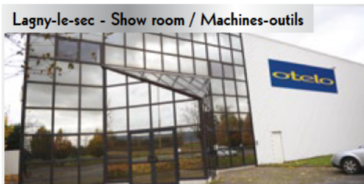
Lagny-le-sec - Show room / Machines-outils

5, rue de la Liberté 60330 Lagny-le-sec - FRANCE Tél. : 01 34 30 38 35 Horaires d'ouverture : du lundi au vendredi 9h00 à 12h30 - 13h30 à 17h00